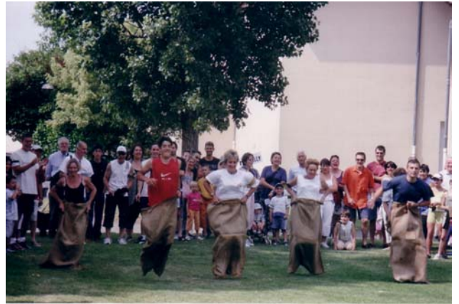
Course en sacs