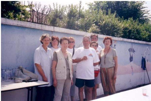
Les animateurs « festif mont d'or Azergues »