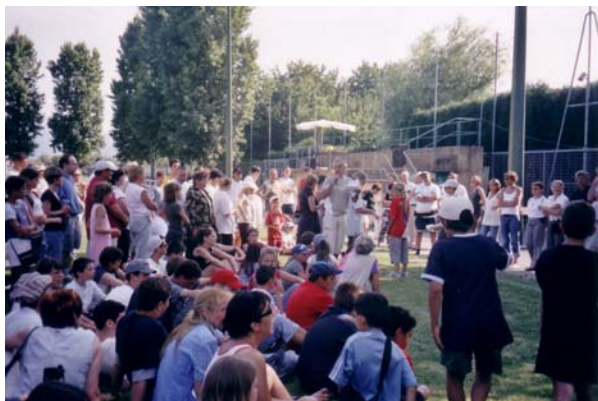
La foule lors de l'épreuve culturelle