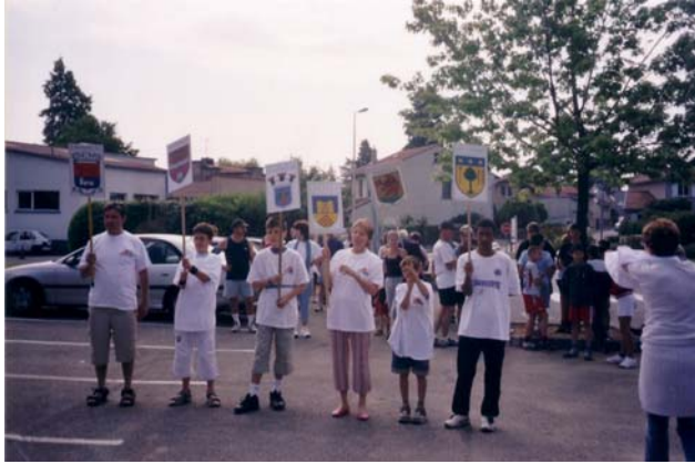
Écussons des communes